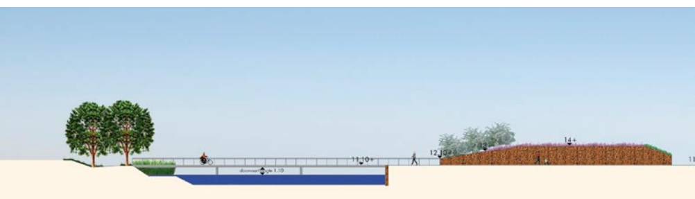
In de Wal Masqué komt een wateropslagkelder

Dat de afrit er komt, is zeker. Maar hoe ziet hij eruit? De beste ontsluiting van Zevenaar bereiken we door de bestaande en de nieuwe afrit (Hengelder en Grietse Poort) met elkaar te combineren. Dan is Zevenaar vanuit oostelijke, westelijke en zuidelijke richting goed te bereiken. In juni 2008 wordt duidelijk of we deze oplossing verder ontwikkelen.